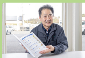
当社は県内の土木や建設業界での知名度は抜群!幅広い世代が働く和気あいの職場!

以前、建設関係で働いていた経験があり、お客様と接する機会が多く、色んな人と知り合えるこの仕事に再び携わりたく強く思い、当社へ転職しました。入社当初は、主にハウスメーカーや工務店を営業するという初めての経験をさせてもらいました。新規の契約が取れたり、事業所のメンバーで目標値が達成したときが働く中で喜びを感じる瞬間です。先輩方の丁寧な指導のおかげで仕事も覚えられ、今では所長を任せてもらえるまでになりました。