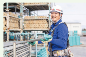
建設現場で必ず必要がある足場。職人として付加価値あるスキルが身につく仕事です

建物を建てるのに必要な足場を組み立てたり、解体する仕事をしています。茨城県南地域の住宅がメインですが、時にビルや倉庫、時に隣の神社仏閣などを手掛けることも。安全第一の現場なので、職長として丁寧に分かりやすくメリハリある指導をして、若手や外国人労働者をまとめ上げています。機械化、自動化が進む世の中ですが、足場はまだ人の価値が下がらない仕事。毎回違う現場なので、飽きないところが魅力です。